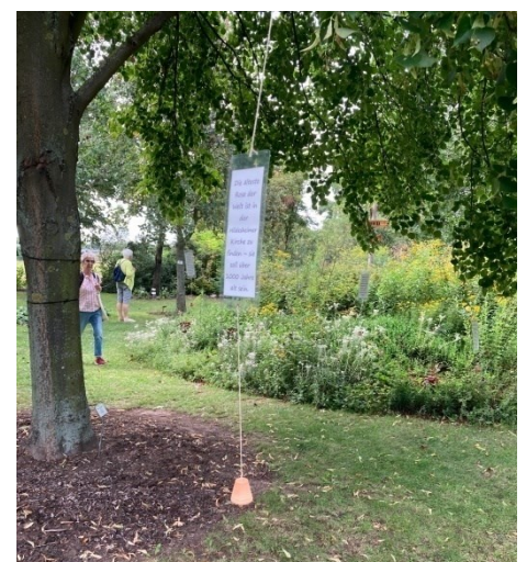
Lernbaum mit interessanten Informationen